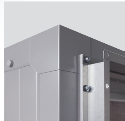
Угловые элементы с уплотнителем, термически разделенные винтовые соединения

С этой целью в конструкции применяются специальные соединения между панелями; возможно также крепление крюков с проушиной для подъема установки.